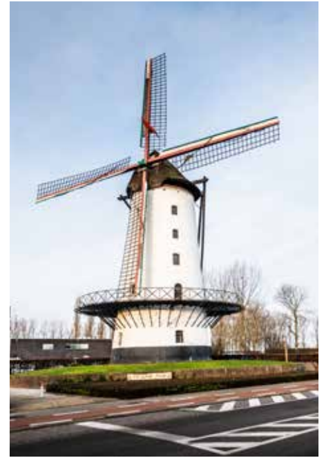
Menen werd lang vereenzelvigd met negatieve zaken. Het tij is aan het keren.