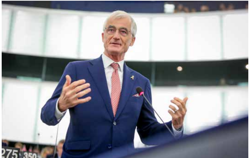
Geert Bourgeois: 'Eén grote federale kieskring zal de kloof tussen de burger en de EU alleen maar vergroten.'

De N-VA-delegatie in het Europees Parlement verzet zich tegen een voorstel over een nieuwe kieswet. Dat voorstel houdt in dat alle kiesgerechtigde EU-burgers niet alleen op kandidaten van hun eigen land of regio kunnen stemmen, maar ook op 28 'transnationale' kandidaten, dus in alle EU-landen tegelijk. Dat komt de facto neer op een pan-Europese kieslijst. 'Een slecht idee', vindt Geert Bourgeois, die de Europese N-VA-delegatie leidt.