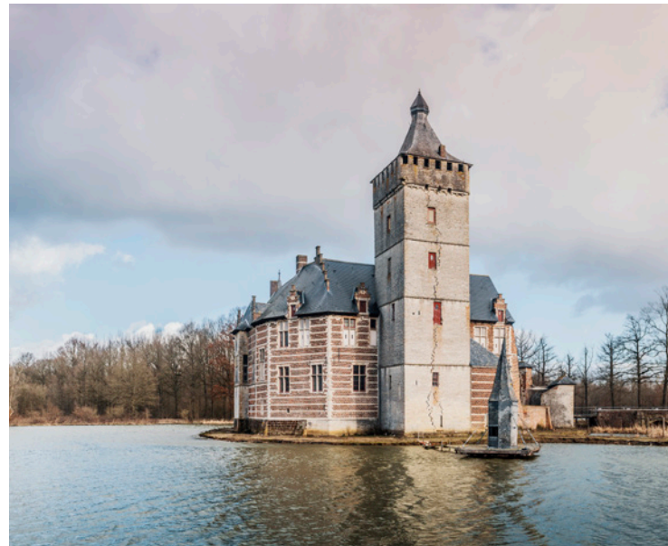
Het kasteel van Horst in deelgemeente Sint-Pieters-Rode.