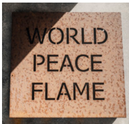
Het 'Monument voor een duif' van kunstenaar Daan Theys herbergt de Wereldvredesvlam.