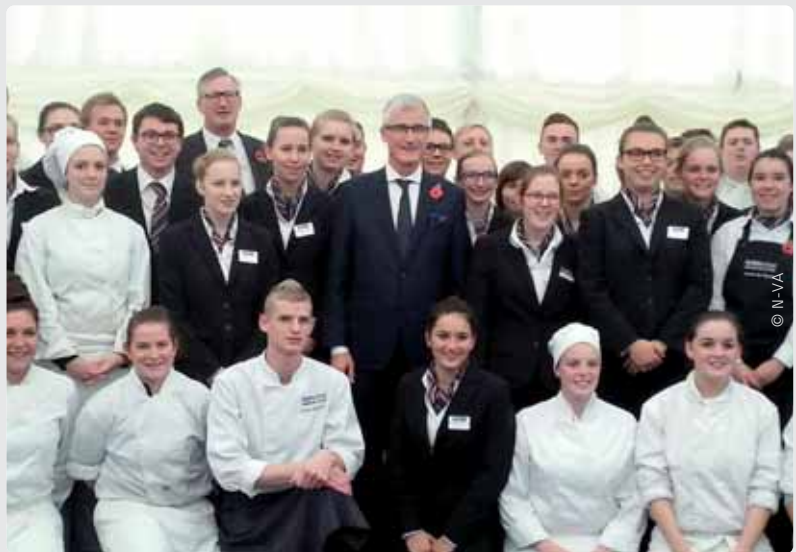
De leerlingen van Hotelschool Kortrijk reisden mee naar Londen en verzorgden er - als ware gastronomische ambassadeurs - de catering.

“Daarnaast moeten we ook volop inzetten op nieuwe vormen van inter-