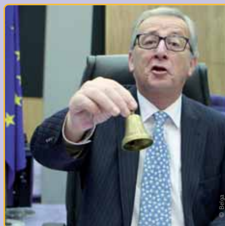
Huidig Commissievoorzitter Jean-Claude Juncker was jarenlang eerste minister van Luxemburg, dat geheime belastingafspraken maakte met grote bedrijven.

Vanzelfsprekend zal de N-VA-delegatie in het Europees Parlement dit dossier van zeer nabij opvolgen. Want als we de belastingdruk eindelijk willen laten dalen, zal eenieder zijn evenredig deel moeten betalen.