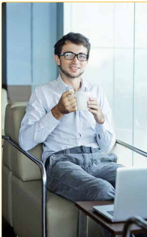
Als ondernemende student met een zelfstandigenstatuut mag je bij lange niet zoveel verdienen als een jobstudent met een arbeidscontract.

Om jongeren te laten proeven van het ondernemerschap zijn er gelukkig wel enkele initiatieven voorhanden. Zo is er het kersverse project StartUpVillage van de stad Antwerpen, dat een vijftigtal jonge starters de kans geeft om goedkoop samen een kantoor te betrekken. Daarmee wil de stad jonge ondernemers naar de stad lokken en hen motiveren om te starten als zelfstandige. Een ander project is een samenwerking van Starterslabo, De