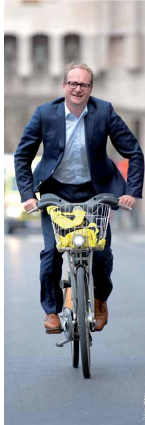
Vlaams minister van Mobiliteit Ben Weyts wil een einde maken aan de verlamme stilstand.

moet leren en bijleren. Het is een collectieve verantwoordelijkheid om altijd voorzichtig te blijven.”