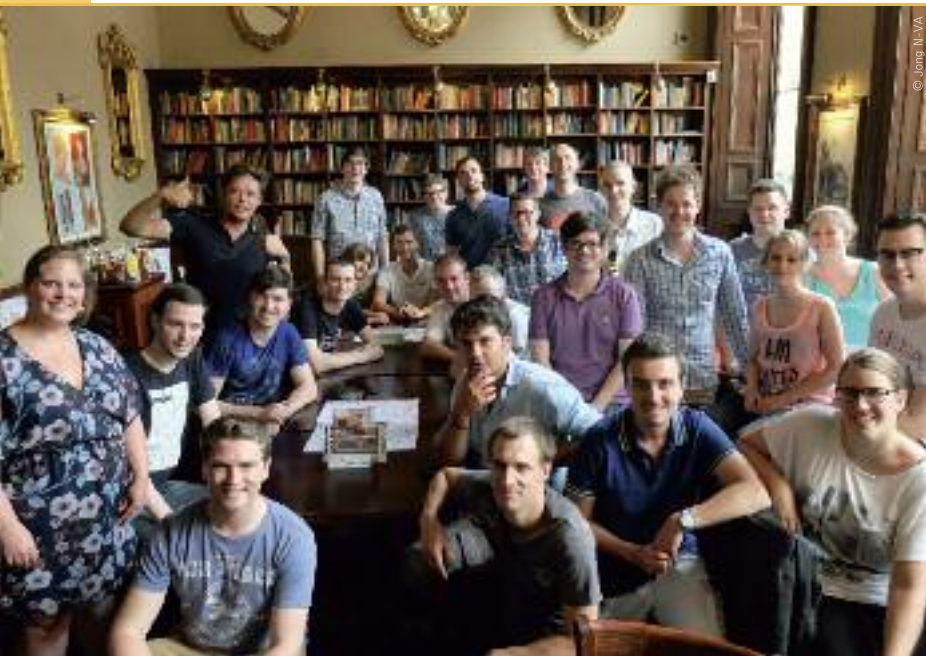
Jong N-VA betreft op een laagdrempelige manier jongeren bij de politiek.

Jong CD&V legt zichzelf op om zo dwars mogelijk in te gaan tegen haar moederpartij en daar moet de belastingbetaler voor opdraaien. Jong N-VA daarentegen wil meewerken aan het Vlaamse project. Door onze financiering te garanderen, zorgt de N-VA ervoor dat wij een meerwaarde kunnen blijven bieden. Zeker nu onze subsidievoorwaarden wegvallen, kunnen wij op een vrije manier de grootste politieke jongerenbeweging van Vlaanderen blijven, ons inhoudelijk verdiepen en onze mensen vormen. Zo zorgen wij voor een doorstroming van ideeën en van mensen. Op die manier is Jong N-VA de motor van vernieuwing van onze partij.