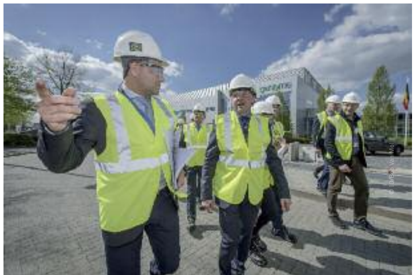
Minister van Innovatie Philippe Muylers bezoekt bijna wekelijks innovatiekampioenen, zoals hier Genzyme-Sanofi in Geel.

"Fantastisch nieuws", vindt Geert Bourgeois. "De inschrijvingscijfers in de STEM-richtingen ( Science, Technology, Engineering, Mathematics ) gaan al een paar jaar in stijgende lijn. We doen daarvoor ook serieuze inspanningen. We gaan met onze onderwijs-hervorming Technologie en Wetenschap nog versterken. Het duaal leren - bijvoorbeeld in samenwerking met BASF - wordt een enorm kanaal om meer jongeren aan boord te houden en extra vaardigheden mee te geven. En tegelijk mogen we ook niet vergeten dat ons onderwijs op dat vlak fantastisch blijft. Er wordt verteld over ongelijkheid, maar ondertussen halen de leerlingen in ons technisch onderwijs wel een hoger niveau in wiskunde dan hun Zweedse evenknieën in de brede graad. Het is met hen dat ze in de internationale economie zullen moeten concurreren."