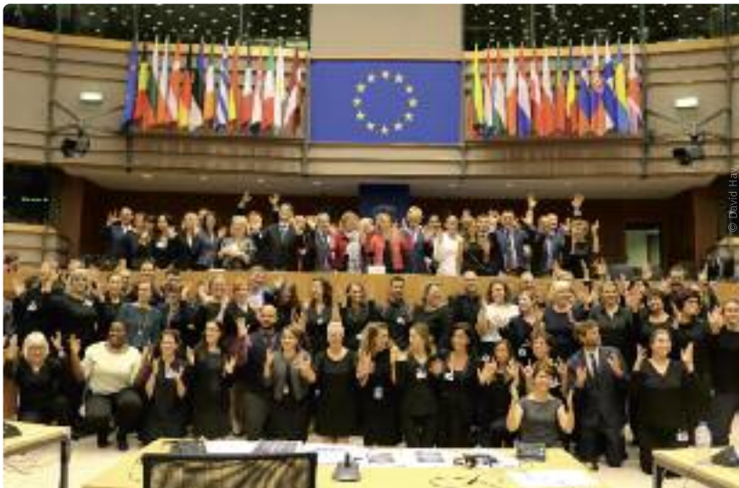
De conferentie bracht voor het eerst alle 31 EU-gebarentalen én alle 24 gesproken EU-talen samen op één plaats.

De ontwerpresolutie focust op gebarentalen en professionele gebarentaaltolken en bouwt verder op de twee bestaande resoluties over gebarentaal uit 1988 en 1998. “De ontwerptekst beklemtoont dat ‘toegang’ ook de toegang tot informatie en communicatie omvat, zowel on- als offline”, verduidelijkt Stevens. “De tekst belicht daarnaast de grote vraag naar gekwalificeerde en professionele gebarentaaltolken en wijst op het belang van opleidingsvereisten, officiële accreditatie en kwaliteitsbewaking voor gebarentaaltolken.” Ten slotte benadrukt Stevens ook het belang van de formele erkenning van gebarentaal op nationaal en/of regionaal niveau, wat nog niet het geval is in bijvoorbeeld Luxemburg en Italië.