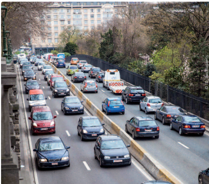
Zes op de tien bedrijven overweegt Brussel te verlaten omwille van mobiliteitsproblemen.