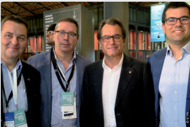
Mark Demesmaeker, Peter Luykx en Sander Loones wensten Artur Mas veel succes.

De regering-Rajoy zal in die nationale verkiezingen verantwoording moeten afleggen voor haar verstikkende unitaristische beleid. Misschien zal een nieuwe regering in Madrid wel oren hebben naar de Catalaanse roep om verandering?