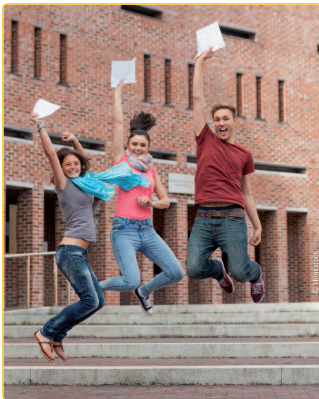
Het huidige opbod van diploma's is op termijn onhoudbaar. En ook ongewenst.

Bovendien dringt de vraag zich op of we wel een wereld willen waarin werkelijk iedereen over een diploma hoger onderwijs beschikt. Want dan daalt ook de waarde ervan. De gevol-