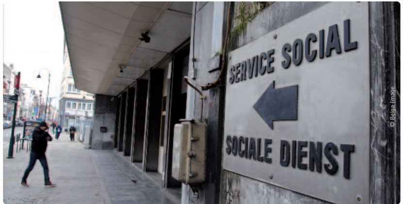
De tweetalige dienstverlening blijft ondermaats in Brussel.

Bij personeelsaanwervingen door de 19 Brusselse gemeenten en OCMW's werd de taalwetgeving in meer dan 75 procent van de gevallen niet gerespecteerd. Bij contractuele aanwervingen liep dat zelfs op tot meer dan 92 procent. Minder dan 37 procent van de leidinggevende functies wordt bovendien ingevuld door Nederlands-