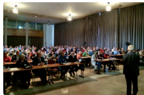
Honderden mandatarissen woonden de praktijkdagen bij in Edegem en, hier op de foto, in Brugge.