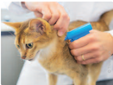
Verplichte registratie moet het aantal zwerfkatten doen afnemen.

Ben Weyts gaf meer uitleg over de kattenchip in de marge van Werelddierendag op 4 oktober. Eind 2016 wil de minister beginnen met een databank van alle geregistreerde katten. “Vandaag is het een beetje een gekke situatie”, vindt de minister. “Nieuwe katten worden wel geregistreerd, maar niet ingegeven in een centrale databank.”