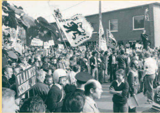
In Komen werd begin jaren tachtig nog een bittere taalstrijd uitgevochten.

Die lijdensweg begon pas goed in 1979, toen de Vlaamse minderheid de oprichting vroeg van een Nederlandstalig schooltje in de Waalse faciliteitsgemeente - al dateerden de plannen daarvoor al van 1974. De Franstalige onderwijsminister weigerde dat verzoek, waarna de kwestie meteen een heuse regeringszaak werd. Uiteindelijk mocht het schooltje er toch komen, in ruil voor de omstreden autoweg Pecq-Armentières, die Komen over Vlaams grondgebied zou verbinden met Wallonië. De Belgische wafelijzerpolitiek op zijn engst. In september 1980 kon het schooltje officieel de deuren openen. Helaas was de vreugde daarover van korte duur: in 1981 besliste een volgende Franstalige onderwijsminister alweer dat het schooltje dicht moest. Intussen waren de gemoederen in Komen