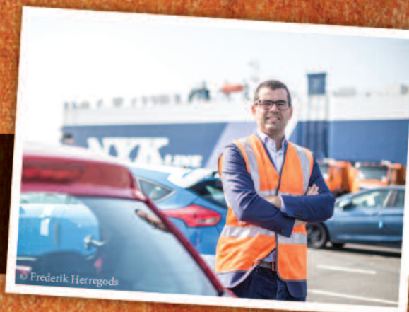
In de Zeebrugse haven volgde Europees Parlements lid Sander Loones een boeiende stage bij International Car Operators.