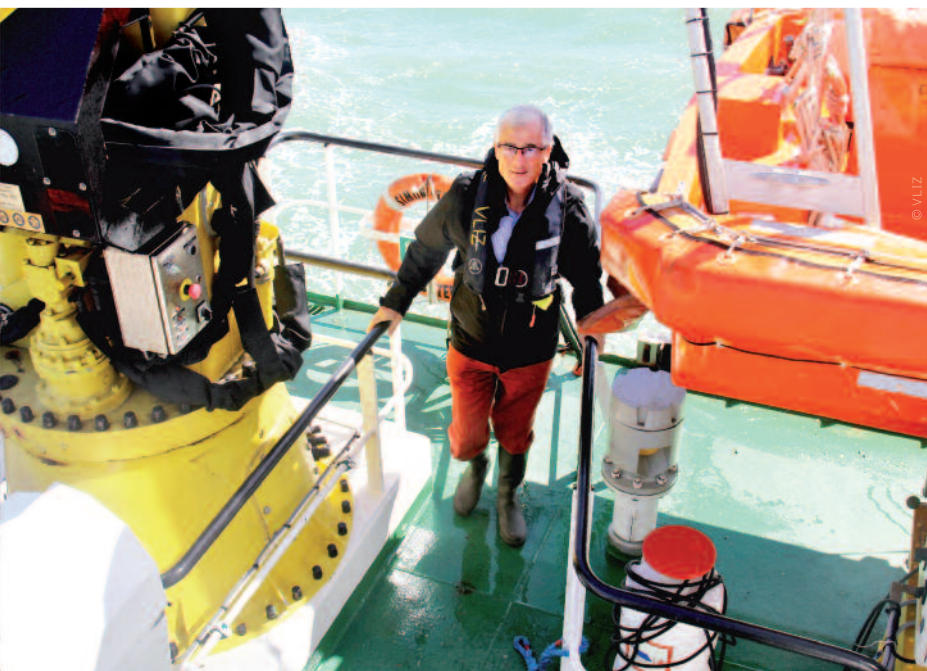
Geert Bourgeois: "Wetenschappelijk onderzoek van de Noordzee is essentieel."

Het idee van de minister-president is niet helemaal nieuw. Onder impuls van Nicolas Sarkozy kwam er in 2008 een Union pour la Méditerranée . Die Unie van het Middellandse Zeegebied omvat 28 lidstaten van de EU en 25 andere landen buiten de EU, zoals Noord-Afrikaanse en Zuidoost-Europese staten en enkele partners uit het Midden-Oosten.