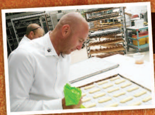
Kamerlid Wouter Raskin bakte zoete broodjes bij de populaire Bakkerij Vangronsveld in Bilzen.

Daarom maakt werkgeversorganisatie Voka van het zomerreces gebruik om politici en ondernemers dichter bij mekaar te brengen met een zomerstage. Een vijftigtal N-VA-parlementsleden ging in op het aanbod.