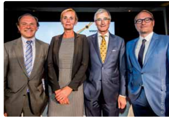
De N-VA-ministers in de Vlaamse Regering: Philippe Muyters, Liesbeth Homans, Geert Bourgeois en Ben Weyts.

Ons programma blijft hetzelfde, maar het sociaal-economische luik is nu prioritair. Mensen moeten goed begrijpen dat we de Vlaamse welvaart willen behouden. Dat is onze verantwoordelijkheid als grootste partij. Dat