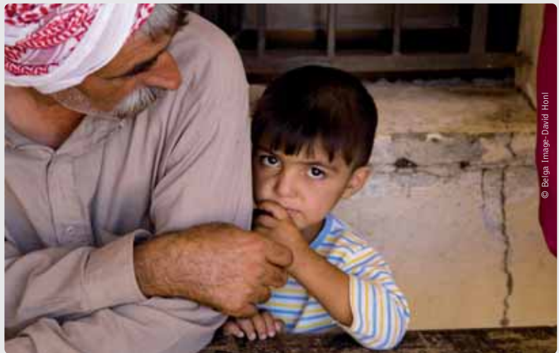
Vlaanderen schenkt 400 000 euro aan het Rode Kruis om de duizenden vluchtelingen in Noord-Irak van hulp te voorzien.