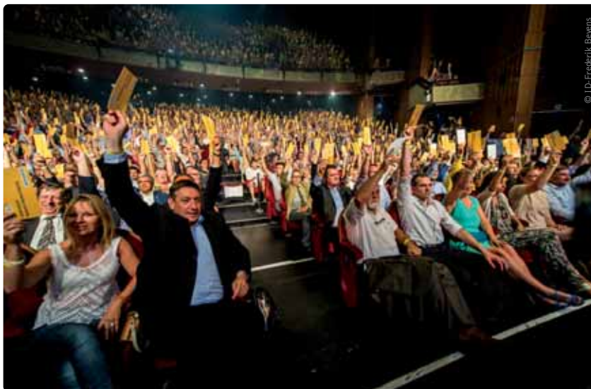
De N-VA bracht op 24 juli meer dan tweeduizend leden samen in Antwerpen om het Vlaams Regeerakkoord te bespreken.

Deze Vlaamse Regering wil enkel verstandig besparen. Om het gat te dichten tussen inkomsten en uitgaven zal ze de uitgaven verminderen in plaats