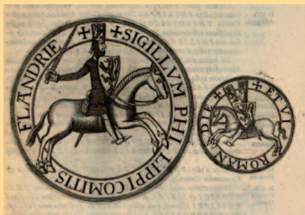
Op het schild, de helm en de banier van Filips van de Elzas staat de oudst gekende weergave van de klimmende leeuw.

Naast het Gentse Gravensteen, de zetel van zijn macht, die hij liet ombouwen naar het model van de Syrische kruisvaardersburchten, is de meest zichtbare en blijvende erfenis van Filips van de Elzas de fiere, klauwende leeuw op het wapenschild van Vlaanderen. Dat Filips dat leeuwsymbool meebracht uit het Midden-Oosten is echter een mythe, zij het wel een zeer hardnekkige.