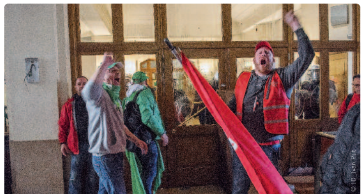
Half mei sloegen betogende cipers het kabinet van de minister van Justitie kort en klein.

maand duurt, leven heel wat gedetineerden in erbarmelijke omstandigheden. “Het stakingsrecht staat niet boven hun mensenrechten”, stelt De Wit. “Sommige gedetineerden krijgen geen levensnoodzakelijke medicatie meer. Als het zo doorgaat, vallen er nog doden. Het is bovendien onaanvaardbaar dat cipers in tijden van terreurdreiging moeten worden vervangen door eenheden van het leger en de politie.”