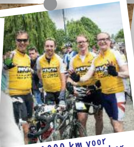
1000 km voor Kom op tegen Kanker