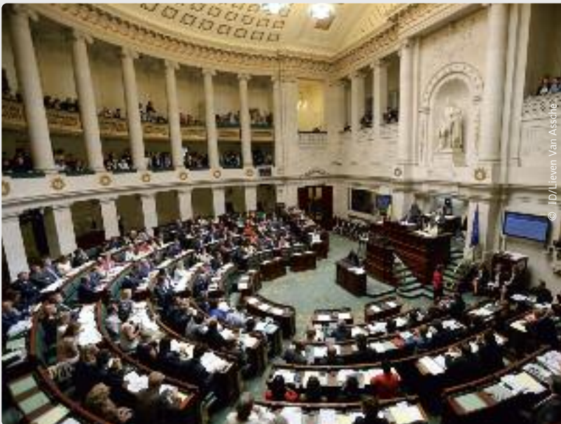
In het Vlaamse, federale en Brusselse parlement werd de Armeense genocide herdacht. Maar veel Turks-Belgische parlementsleden stuurden hun kat.

Het moet gezegd: niet alle politici met Turkse roots lieten de herdenking links liggen. Er waren er zelfs bij van PS-signatuur. Ook prominent aanwezig in de Kamer: Zuhal Demir. U weet wel, van die partij die bij Laurette Onkelinx het geluid van marcherende laarzen oproept. Toch liet die laatste optekenen dat ze niet te spreken is over het gedrag van de Brusselse PS-parlementsleden. Misschien ingegeven door voorouderlijk advies? Ook nationaal PS-voorzitter Di Rupo verklaarde dat hij tekst en uitleg verwachtte. Al bleek dat maar stoere praat: Kir blijft ongestraft.