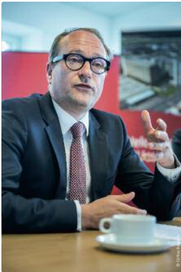
Minister van Dierenwelzijn Ben Weyts: “Voor parketten is ‘kleine’ dierenmishandeling niet altijd een prioriteit. Toch moet er direct worden opgetreden.”

“Maar er zijn veel dieren in Vlaanderen, en een pak minder inspecteurs. Grondige controles duren ook langer, en dan kan je het aantal niet zo snel opdrijven. Mijn diensten doen wat ze kunnen, maar het zijn ook maar mensen natuurlijk. Gelukkig is er een oplossing: lokale besturen kunnen veel doen om mee te waken over het welzijn van dieren.”