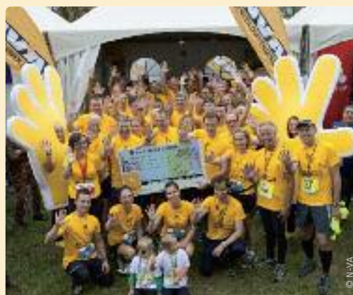
Meer dan 60 N-VA-#Helfies liepen 26 397 euro bij elkaar voor peuter Sterre op de ‘Antwerp 10 Miles’.

Bij het afsluiten van de veiling op zondagavond 3 mei stond er meer dan 14 300 euro op de teller. “Onze dank gaat dubbel en dik uit naar de vele #Helfies die een bod uitbrachten en ook van deze actie ten voordele van het kankeronderzoek een doorslaand succes maakten”, zegt N-VA-voorzitter Bart De Wever.