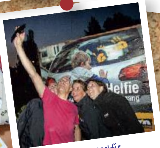
Word ook #Helfie