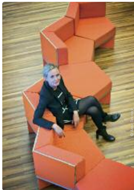
Liesbeth Homans: “Inburgeren is en blijft voor iedereen een positief verhaal.”

“Dat kan niet langer”, vindt minister Homans, die de inburgeringsplicht wil invoeren voor nieuwkomers die binnen de vijf jaar vanuit Brussel of Wallonië naar Vlaanderen verhuizen. “Dat betekent dat zij lessen Nederlands en maatschappelijke oriëntatie moeten volgen. Net zoals alle andere nieuwkomers”, besluit Homans.