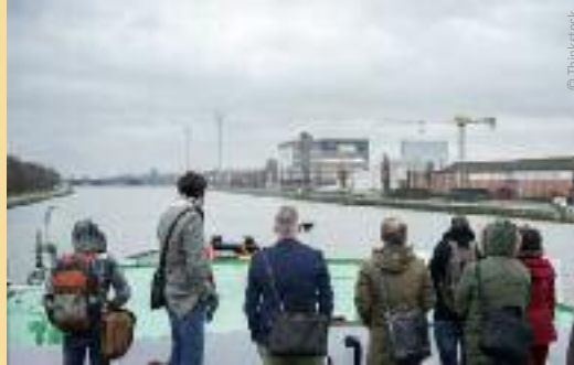
Communaautaire geschillen vertraagden de aanleg van het Albertkanaal.

Limburgse vertegenwoordigers die uiteindelijk de aanleg van het kanaal erdoor drukten, want Limburg had nood aan een kanaal dat de steenkoolmijnen zou ontsluiten. En ook na de sluiting van die mijnen blijft het Albertkanaal vandaag een belangrijke vervoersader voor het land.