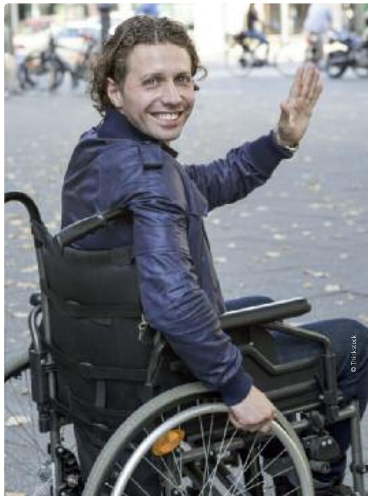
Personen met een beperking hoeven niet meer zelf uit te zoeken voor welke maatregelen ze in aanmerking komen.

De staatssecretaris wijst er ten slotte ook op dat de persoon met een beperking daarbij altijd zelf de regie behoudt en op eenvoudig verzoek de automatische gegevensuitwisseling kan stopzetten.