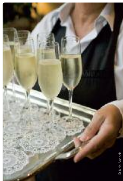
De overuren worden goedkoper voor werkgevers en financieel gunstiger voor werknemers.

De regering keurde ook de invoering van flexi-jobs goed. Wie minimaal een vier vijfdejob heeft bij een andere werkgever, kan voortaan in de horeca bijverdienen aan een nettoloon, aangevuld met 25 procent werkgeversbijdragen.