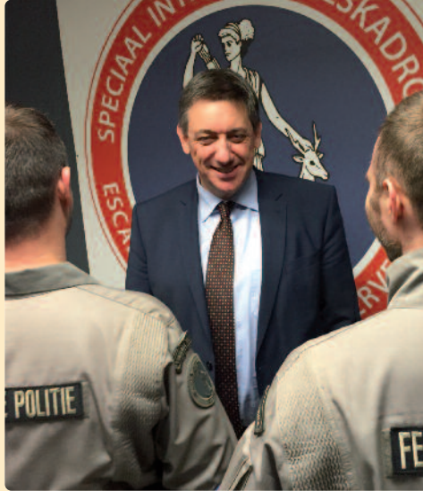
Jan Jambon: “Je kan niet op enkele maanden rechtzetten wat jarenlang verkeerd is gelopen.”

Zo is er het bekende ‘Plan Kanaal’, waarmee Jambon in acht gemeenten in de Brusselse kanaalzone de broeihaarden van jihadisme wil aanpakken. “In een