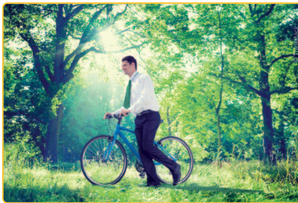
Ecorealisme is het huwelijk tussen de vrije markt en ecologie.

Met andere woorden: ecorealisme is het huwelijk tussen de vrije markt en ecologie. “We beantwoorden de klimaatuitdagingen vanuit ratio en wetenschap, niet vanuit sentiment”, aldus Tomas. “De commissie Duurzaamheid nam op het congres verschillende standpunten in die daarbij aansluiten.”