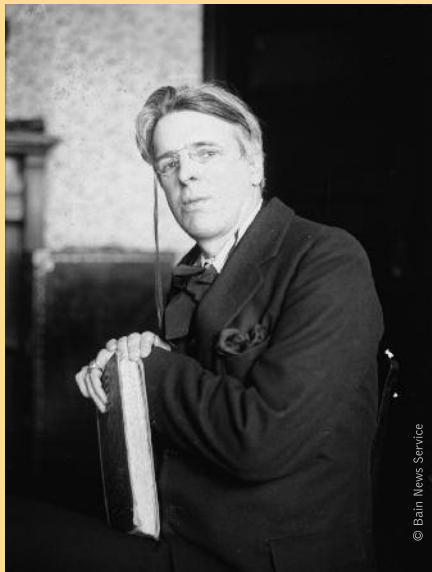
‘Easter, 1916’ van de bekende dichter W.B. Yeats werd een hymne.

heidsstrijd gehaald. Maar de Engelsen overspeelden op brute manier hun hand: in de nasleep van het gebeuren executeerden ze bijna alle leiders van de opstand, tot en met de al zwaargewonde James Connolly, die op een stoel moest zitten bij zijn terechtstelling omdat hij niet meer kon staan.