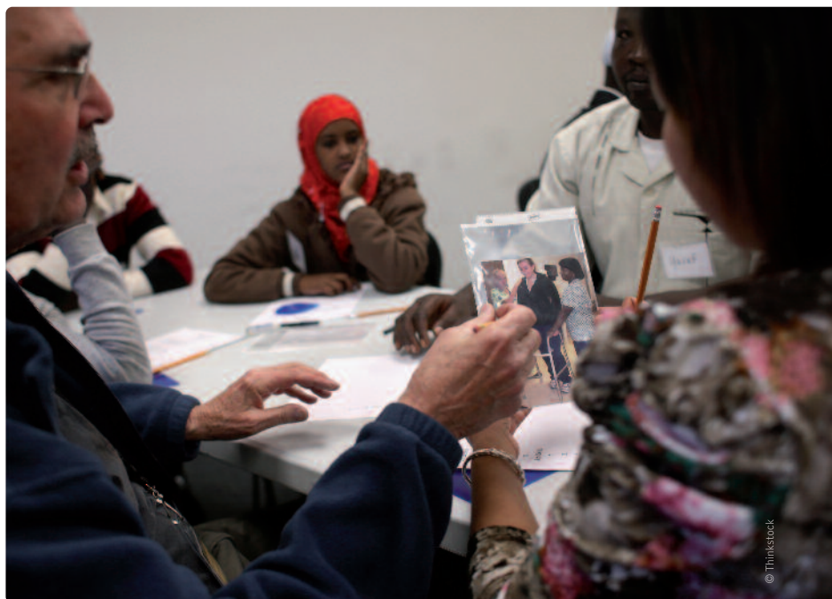
De koppeling van het verblijfsrecht aan de wil tot integratie is revolutionair.

De integratieplicht geldt voor het overgrote deel van de niet-Europese nieuwkomers. Alleen voor EU-burgers, studenten en asielzoekers geldt ze niet, al zal ook aan die laatsten worden gevraagd om de nieuwkomersverklaring te ondertekenen. De Conventie van Genève laat echter niet toe om dat bij hen af te dwingen. "Iedereen spreekt ook altijd over asielzoekers," geeft Francken tot besluit nog mee, "maar uiteindelijk blijft gezinshereniging bij ons het grootste migratiekanaal. Vooral met het oog op een betere integratie van die grote groep van nieuwkomers is deze extra verblijfsvoorwaarde een belangrijke stap voorwaarts."