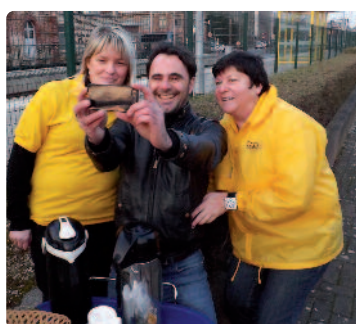
De afdeling in Herzele schonk warme koffie bij de chocolade én maakte tussendoor wat tijd voor een selfie.