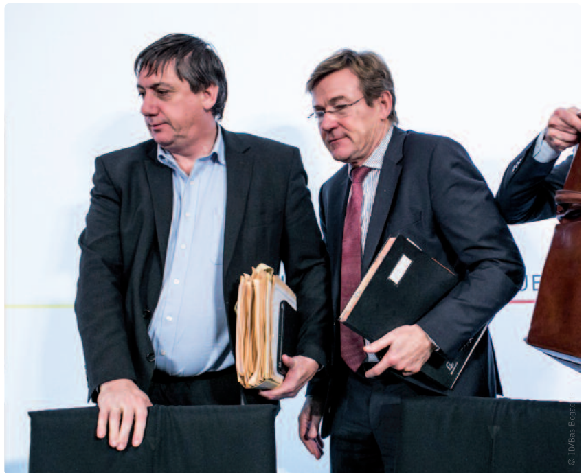
Vice-eerste minister Jan Jambon en minister van Financiën Johan Van Overtveldt gooiden hun gewicht in de schaal om tot een goed sociaal akkoord te komen.

Jan Jambon: “Dat is echt niet terecht. De welvaartsenveloppe - alleen al dit jaar een bedrag van meer dan 300 miljoen euro - is voor de volle honderd procent toegekend aan de laagste sociale uitkeringen. Daarmee zijn we zelfs socialer dan de regering-Di Rupo. Het verschil is dat wij hulp voorzien voor de mensen die het echt nodig hebben, zoals gepensioneerden en mensen met een beperking. De laagste uitkeringen gaan met twee procent de hoogte in. Ik denk dus dat we van niemand lessen in sociaal beleid te ontvangen hebben.”