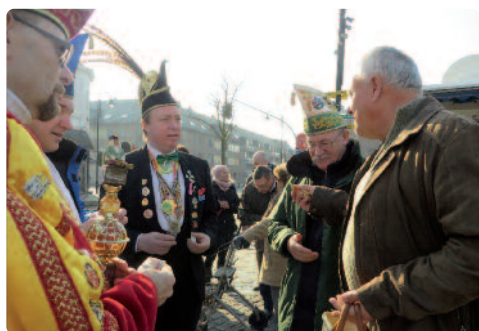
Ook de carnavalisten in Dessel lustten wel een chocolaatje van de N-VA.