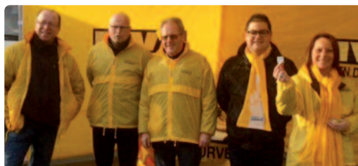
In Eindhoven deelden enthousiaste N-VA'ers valentijnchocolade uit op de zaterdagmarkt.