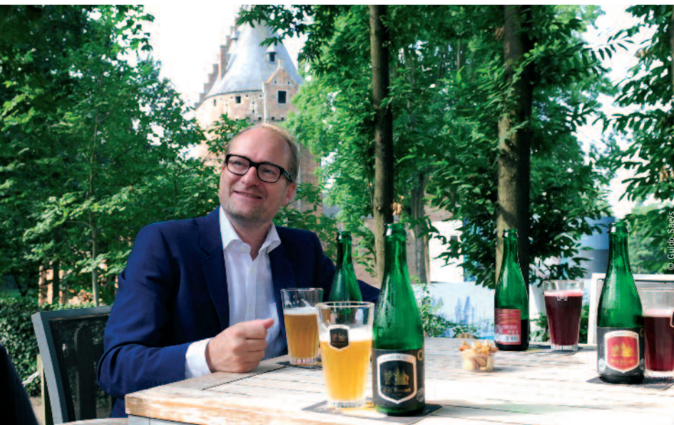
Ben Weyts: “Ik wil heel gericht initiatieven uitzoeken die het grootste rendement hebben voor onze economie.”

“Voor veel Vlamingen is vakantie ondertussen de normaalste zaak van de wereld. Maar nog altijd leeft één kind op de vijf in een gezin waar een week vakantie buitenshuis niet tot de mogelijkheden behoort. Ik wil de drempels op weg naar vakantie verder verlagen, zodat vakantie binnen het bereik van elke Vlaming komt. Ik denk dan aan mensen met een klein inkomen, maar ook aan mensen die bijzondere zorgnoden hebben, zoals mensen met een beperking. Het Steunpunt Vakantieparticipatie brengt die doelgroep samen met sociaal bewogen toeristische ondernemers, lokale overheden en sociale organisaties. Zo maken we daguitstappen en korte vakanties mogelijk voor mensen die het zich anders niet kunnen veroorloven. Want iedereen heeft recht op vakantie.”