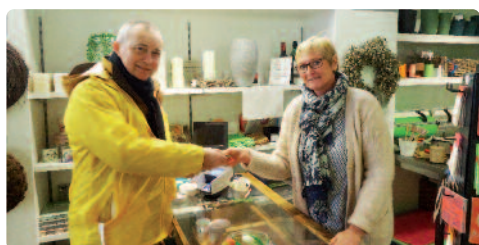
N-VA Morsel heeft een hart voor ... zelfstandige ondernemers.

Naar jaarlijkse gewoonte vierde de N-VA Valentijn in de week van 14 februari. En zoals de traditie dat wil, deden onze afdelingen dat met een glimlach, een liefdevolle wens en met veel chocolade!