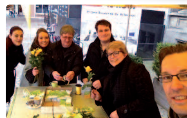
N-VA Lier deelde niet enkel chocolade uit. De Lierse marktkramers, shoppers en cafébezoekers kregen er een gele roos bovenop.