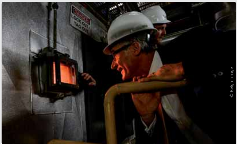
Geert Bourgeois op handelsmissie in Singapore: “Het gaat in de eerste plaats om jobs. Onze export is de motor van onze welvaart en ons welzijn.”

ten kan kopen.” Onze bedrijven hebben ook te maken met de gevolgen van de crisis in Oost-Europa en de Russische sancties. “Daarom moet Vlaanderen steeds opnieuw op zoek naar nieuwe afzetmarkten voor zowel traditionele als innovatieve producten. Mede dankzij de inspanningen van FIT kan Vlaams fruit, dat niet meer op de Russische markt kan worden verkocht, nu doordringen op de Indische markt. Daarnaast werken we ook nauw samen met Nederland. Volgend jaar organiseren we opnieuw een gezamenlijke handelsmissie Nederland-Vlaanderen.”