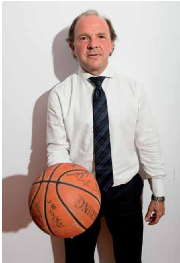
Minister Philippe Muyters: “Sportclubs zijn de ideale partner om samen met de VDAB uit te zoeken hoe sporten een meerwaarde kan zijn in een traject naar werk.”

geen competenties op-rapen”, aldus de minister. “Het is dus logisch dat we een proefproject opstarten met jongeren die al interesse hebben in sporten. Daarnaast zijn sportclubs de ideale partner om samen met de VDAB uit te zoeken hoe sporten een meerwaarde kan zijn in een traject naar werk. Want het gaat hier niet om vrijblijvend wat gaan lopen, integendeel. De werkzoekende moet terecht komen in een professionele omgeving met een kwaliteitsvolle werking en een goede begeleiding. Als aan die voorwaarden is voldaan, ben ik er zeker van dat sporten kan helpen om iemands kansen te vergroten op de arbeidsmarkt.”