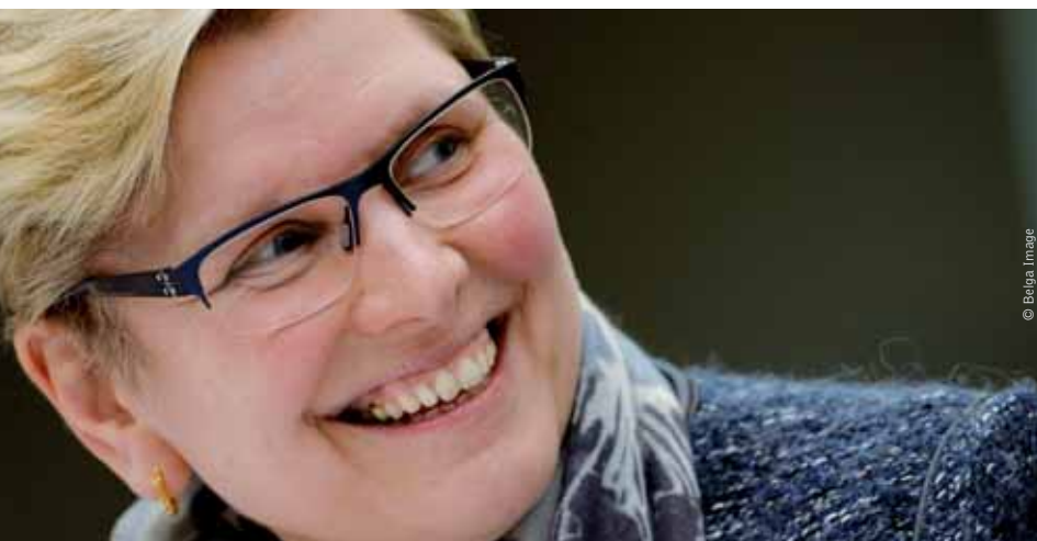
Staatssecretaris voor Armoedebestrijding Elke Sleurs: "Winteropvang is de facto slechts een tijdelijke maatregel."