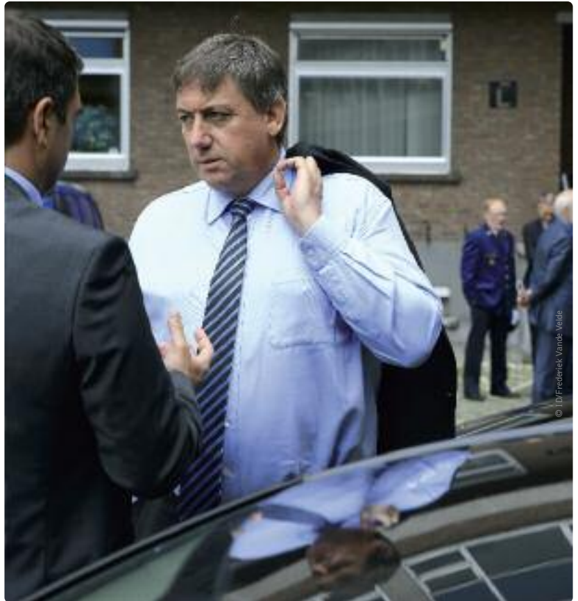
Jan Jambon: “Sneller en efficiënter optreden tegen terrorisme is absoluut noodzakelijk om onze veiligheid te waarborgen.”

Tegen eind volgend jaar plannen we bovendien de algemene invoering