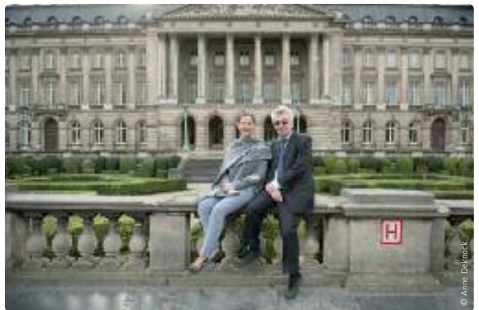
Veerle Wouters en Hendrik Vuye willen de dotatie van Laurent laten uitdoven.

Uit een rapport van het Rekenhof blijkt dat prins Laurent privé-uitgaven financiert met zijn dotatie. “Daarmee is hij niet aan zijn proefstuk toe”, constateren Kamerleden Veerle Wouters en Hendrik Vuye. “Dat iemand overheidsgeld als zijn persoonlijke eigendom behandelt, is surrealistisch. Dit kan niet”, vinden zij. Vandaar hun voorstel om die dotatie over een periode van vijf jaar te laten uitdoven.