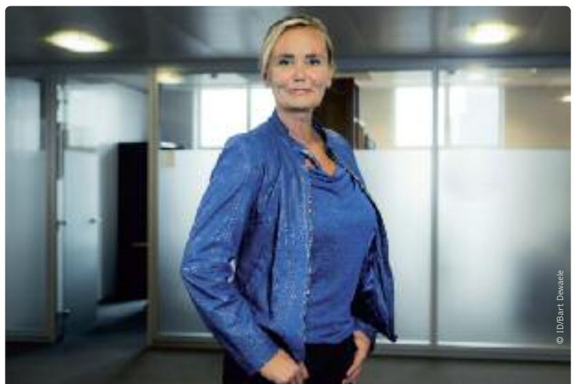
Vlaams minister van Wonen Liesbeth Homans wil de totale woningkwaliteit optrekken.