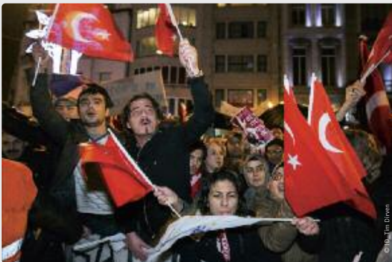
De Turkse premier Erdogan - ‘de populairste politicus van België’ - sprak in Brussel zowat drieduizend aanhangers toe.

Dat een ongeremde Erdogan bovendien de stabiliteit van Turkije in het gedrang brengt, is nog een reden om realistisch maar kritisch om te gaan met dat sleutelland tussen Europa en het Midden-Oosten.