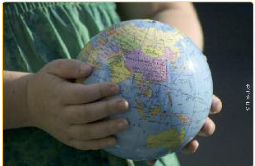
Het klimaatthema overlaten aan groene partijen zou een ramp zijn voor het klimaat.

De klimaatop in Parijs komt er binnenkort aan. Jong N-VA roept iedere