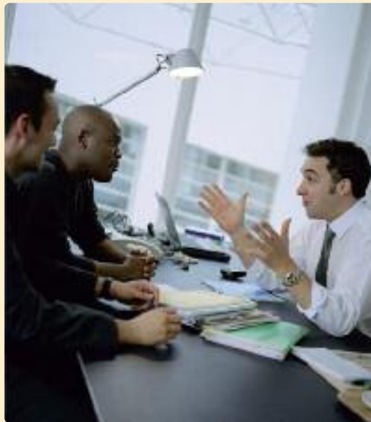
Wie gepassioneerd werkt is productiever, minder vaak ziek en blijft langer aan de slag.

samen veel bereiken zonder dat de overheid dat moet vastleggen in regeltjes. Maar er moet ook voldoende aandacht gaan naar ‘werkbaar ondernemerschap’, want de principes van werkbaar werk gelden evengoed voor bijvoorbeeld zelfstandigen.”