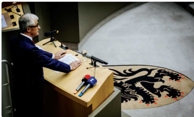
Geert Bourgeois: “We blijven fors investeren. En dat zonder nieuwe belastingen.”

groeien. Na de twee investeringsgolven van 400 miljoen euro in 2016 en 2017, lanceren we in 2018 een derde investeringsgolf van liefst 610 miljoen euro. We blijven de klemtoon leggen