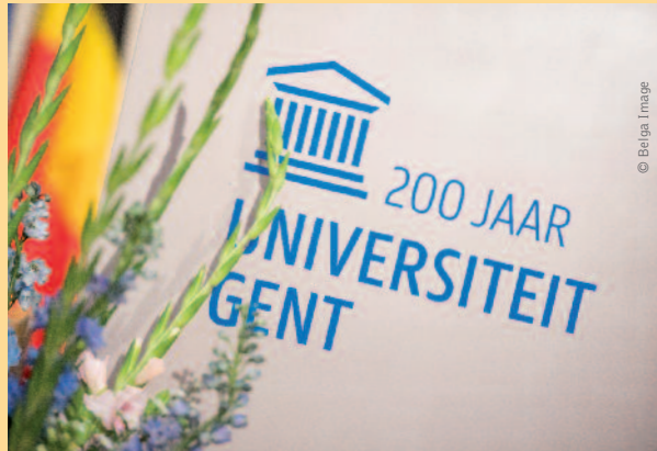
Tot op vandaag is de Aula het symbool van de Universiteit Gent.

wetsvoorstel ook effectief in behandeling werd genomen. Maar door het uitbreken van de Eerste Wereldoorlog kwam er niets van in huis. De Duitse overheid vernederlandste kortstondig de universiteit, maar die werd onmiddellijk na de bevrijding opnieuw verfranst.