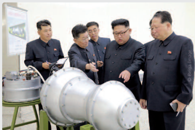
De nucleaire capaciteit van Noord-Korea en zijn president Kim Jong-un kan niet langer worden ontkend.

De Europese Unie is nergens te bekennen in de crisis rond Noord-Korea.