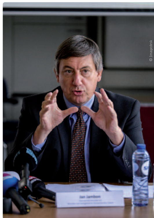
Jan Jambon: "Met Mijn DOSSIER streven we naar administratieve vereenvoudiging."

Via Mijn DOSSIER biedt het Rijksregister ook de mogelijkheid aan burgers om vrijwillig (enkele van) hun contactgegevens te delen. "De overheidsinstanties die toegang hebben tot die gegevens kunnen zo sneller en directer met de burger communiceren", besluit Jambon.