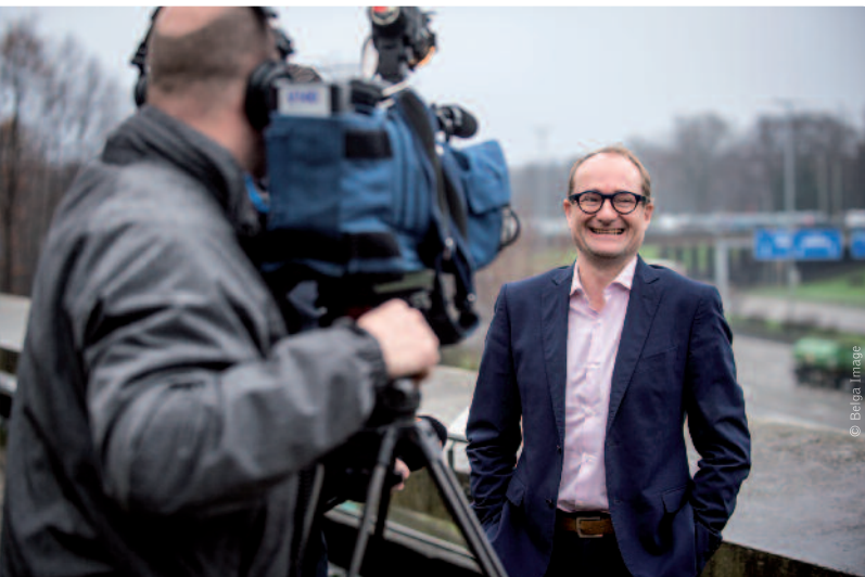
Ben Weyts: "We brengen het Oosterweelproject nu op kruissnelheid."

Vlaams minister van Mobiliteit en Openbare Werken Ben Weyts zet binnenkort de eerste spadesteek voor Oosterweel. Voor één keer is het woord 'historisch' op zijn plaats.