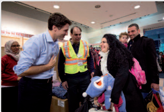
De Canadese premier Trudeau ging eind 2015 zelf nog vluchtelingen begroeten op de luchthaven. Het Canadese 'Wir schaffen das' leidde tot een instroom van 250 illegale immigranten per dag.

In de Verenigde Staten worden de profilmmpjes van de knappe Trudeau intussen gretig gedeeld op de sociale media door Haïtiaanse inwijkelingen. De Amerikaanse president Donald Trump laat verstaan dat hij de 56 000 Haïtianen in de VS weg wil. Zij hopen naar gastvrij Canada te kunnen, hoewel hun asielaanvraag meestal kansloos is.