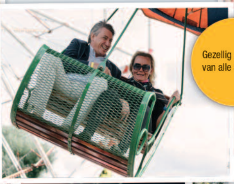
Gezellig genieten van alle attracties