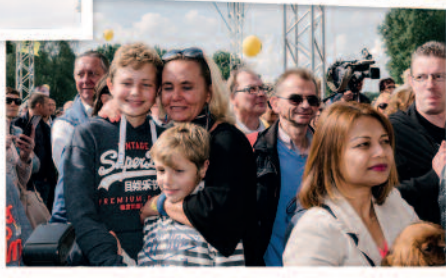
"N-VA kiezen is kiezen voor Verantwoordelijkheid voor welvaart, een Veilige thuis, Vlaamse identiteit"