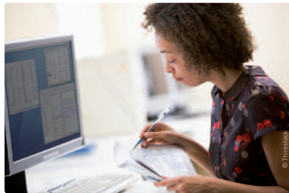
De VDAB helpt werkzoekenden op een moderne manier aan een job.

Intussen daalt de Vlaamse werkloosheid al twee jaar aan een stuk. En dat in elke leeftijdscategorie, voor elk studieniveau en bij elke werkloosheidsduur. Concreet telde Vlaanderen eind juli nog slechts 225 044 werkzoekenden. Dat zijn er 13 049 of 5,5 procent minder dan een jaar eerder. In die-