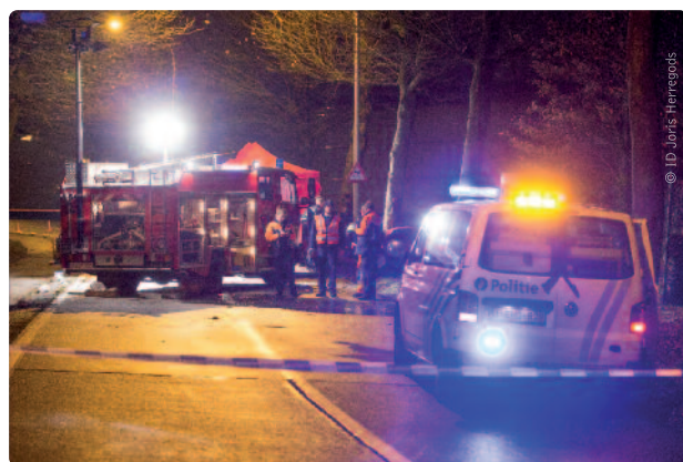
Bij elk dodelijk slachtoffer wordt ook een hele familie, vriendenkring en omgeving hard geraakt.

“Het lijkt erop dat onze inspanningen beginnen te lonen: Vlaanderen is nu veruit de beste leerling van de Belgische klas. Voor mij is dat een aanmoediging om verder te gaan op de ingeslagen weg”, verklaart Weyts, die nog lang niet op zijn lauweren gaat rusten. “Ik krijg vaak kritiek als ik met een onpopulaire maatregel kom, zoals de extra trajectcontroles. Maar de barometer geeft 28 verkeersdoden minder aan. Als ook maar een paar van die mensen zijn gered door de nieuwe beleidskeuzes, dan is dat alle kritiek waard geweest.”