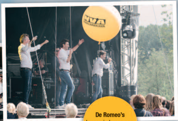
De Romeo's kregen iedereen aan het dansen