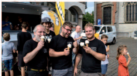
N-VA vraagt vrije dag met gratis ijjes. Aan de vooravond van de Vlaamse feestdag vroeg de lokale N-VA afdeling in Sint-Niklaas traditiegetrouw aandacht om 11 juli te erkennen als wettelijke feestdag. In tegenstelling tot bloemen werden er dit jaar ijjes uitgedeeld en die vielen in de smaak bij de passanten aan het Sint-Nicolaasplein. #ijjes