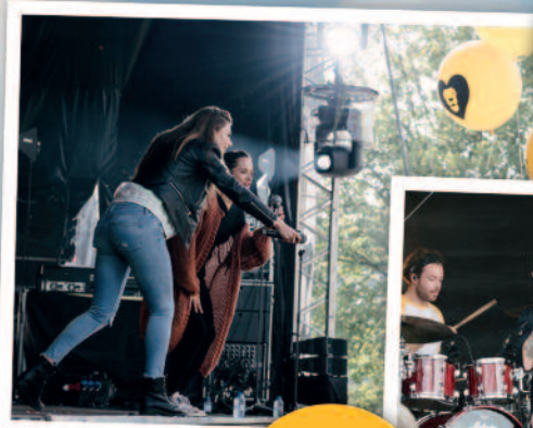
De Bende opende samen met alle kinderen de familiedag