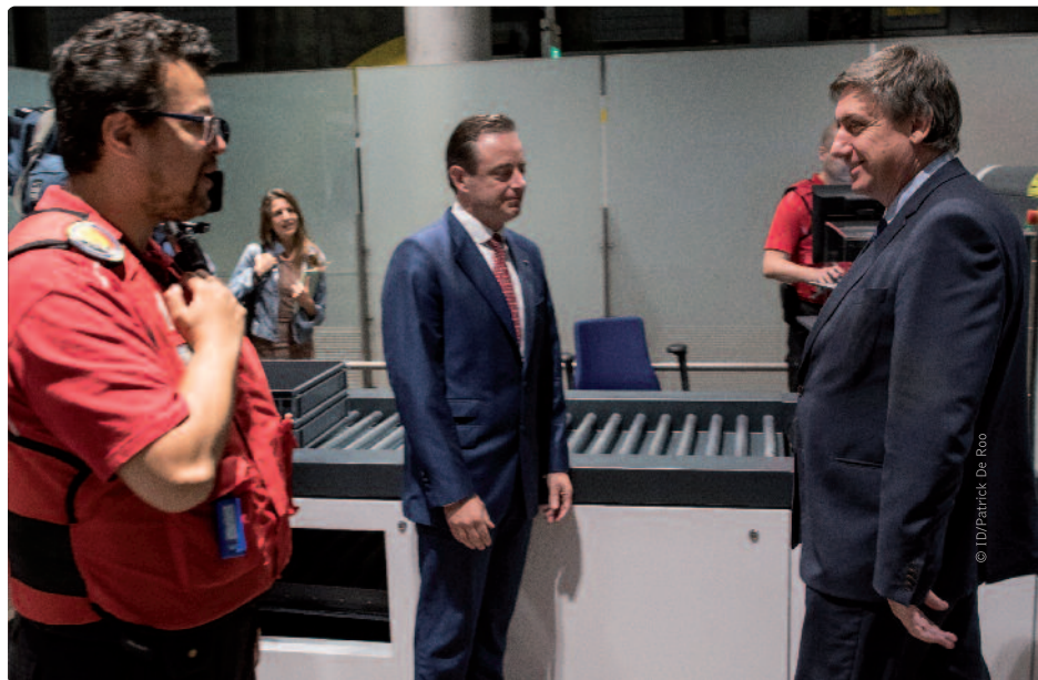
In juli stelden burgemeester Bart De Wever en minister Jan Jambon nog nieuwe veiligheidsmaatregelen voor in het Antwerpse Centraal Station.

elkaar afstemmen om de drugsmaffia klem te rijden. De mosterd voor die verbeterde samenwerking halen ze bij het Kanaalplan tegen terrorisme, waarvan de concrete resultaten meer en meer zichtbaar worden. De kracht van zowel het Stroom- als het Kanaalplan is dat verdachten die op zwarte lijsten staan in een soort fuik terecht komen doordat politie en gerecht,