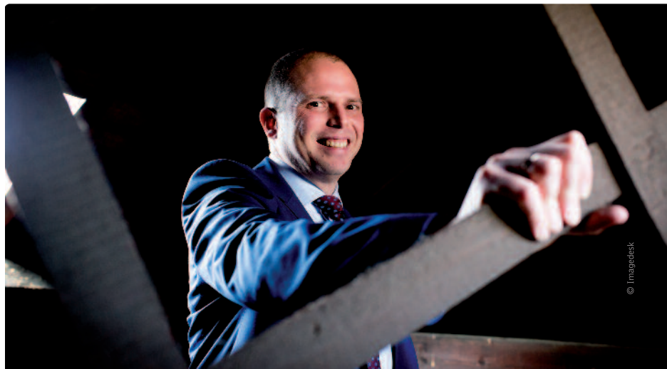
Theo Francken: “Illegale criminelen worden nu grotendeels rechtstreeks uit de gevangenis gehaald en gerepatrieerd.”

vangenis gehaald en gerepatrieerd, zonder te passeren langs de gesloten centra, wat een enorme efficiëntiewinst betekent. Op dat vlak blijven we historische records breken. In 2014 brachten we 625 criminelen terug. Dit jaar mikken we op 1 800. Daarmee ontlasten we het gevangeniswezen én verlagen we de criminaliteit, want onder illegale criminelen ligt de recidive torenhoog.”