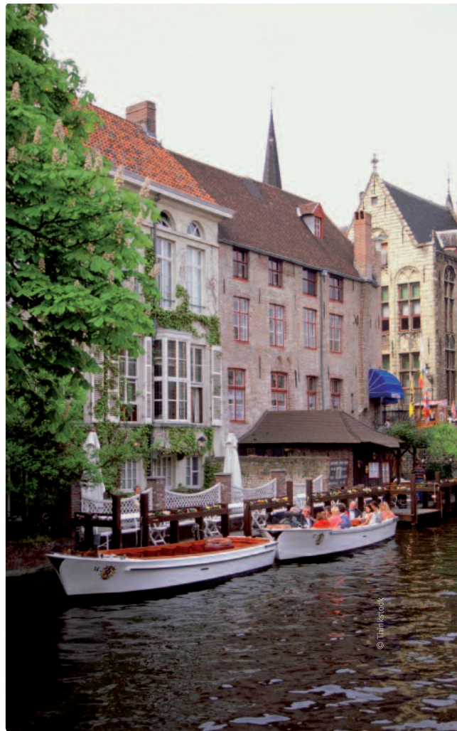
Met onze Vlaamse gastronomie, onze Vlaamse Meesters en ons Vlaamse wielercultuur hebben we onverwoestbare uithangborden.

deren te halen. We trekken daar ongeveer 1 miljoen euro voor uit. Gelukkig hoeven we nergens te smeken om toeristen. We hebben nog altijd een ijzersterk aanbod. Zelfs veel Vlamingen onderschatten wat Vlaanderen allemaal te bieden heeft. Ik kan dus