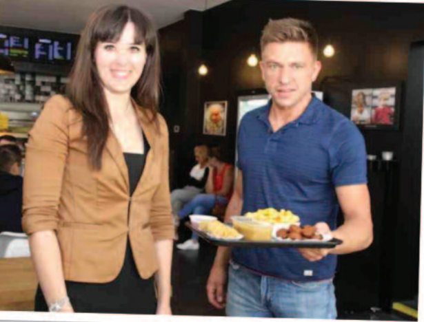
© Het Nieuwsblad, 21 mei 2017