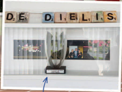
De Dielis kreeg in 2013 de 'Toerisme voor Allen'-award van Toerisme Vlaanderen.