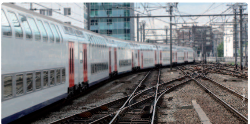
© W. W. S. B. K.

minstens vier dagen op voorhand zijn keuze moeten melden. “Zonder die meldingsplicht kan je onmogelijk een minimumdienst uitwerken”, aldus De Coninck. De NMBS zal ook 24 uur vooraf moeten communiceren welke treindienst ze aanbiedt op een stakingsdag, zodat de reiziger weet of hij al dan niet met de trein op zijn bestemming geraakt.