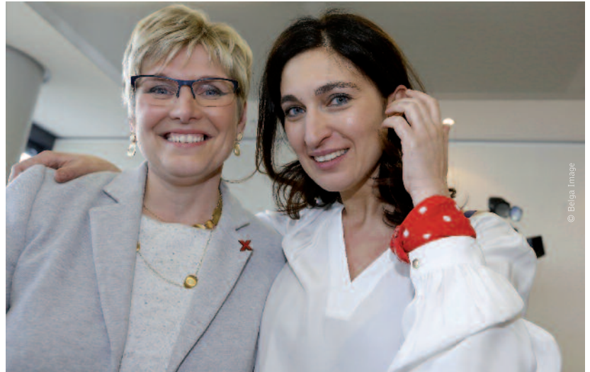
Zuhal Demir, met het rode kompelsjaaltje van haar vader om de pols: “Elke werkt liever in de luwte, terwijl ik ben geboren met een grote mond.”

een slachtoffer, maar als je je perfect integreert en je geen slachtofferschap laat aanpraten, dan ben je een ‘zogenamde allochtoon’. Moet ik dan een hoofddoek dragen misschien?