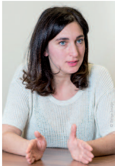
Zuhal Demir: “Gelijke kansen zijn niet gediend met uitzonderingsmaatregelen in de marge voor moslima’s.”

“Mijn eerste prioriteit is om de zaken daar recht te trekken. Het is gewoon onaanvaardbaar dat de meest kwetsbaren