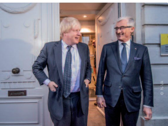
Minister-president Geert Bourgeois had een bilateraal onderhoud met de Britse minister van Buitenlandse Zaken, Boris Johnson.

Deze maand nog verwelkomde Bourgeois de CEO van de Londense kamer van koophandel, die op uitnodiging van Voka een bezoek bracht aan Vlaanderen. Bij die gelegenheid sprak Bourgeois ook met Vlaamse bedrijfsleiders van enkele geviseerde sectoren. Last but not least had onze minister-president een bilateraal onderhoud met de Britse minister van Buitenlandse Zaken, Boris Johnson.