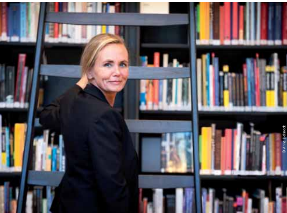
Vlaams minister van Binnenlands Bestuur Liesbeth Homans: "Door de integratie van het OCMW in de gemeente kunnen we meer doen voor de zwaksten in de samenleving."

Voor de integratie bestaat er op lokaal vlak al een groot draagvlak. Sinds de huidige lokale bestuursperiode maken de OCMW-voorzitters al deel uit van het schepencollege. Bovendien hebben heel wat steden en gemeenten al stappen gezet om de ondersteunende diensten te integreren. "Er is grote eensgezindheid dat men door de krachten te bundelen zoveel meer kan gaan doen. En dat is nu net de bedoeling van deze oefening", besluit de minister.