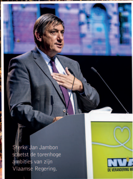
Sterke Jan Jambon schetst de torenhoge ambities van zijn Vlaamse Regering.