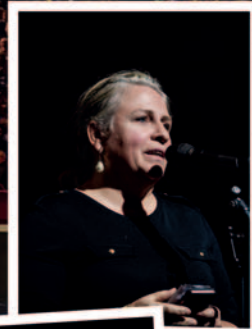
25 N-VA-leden gebruiken hun spreekrecht om vragen te stellen.