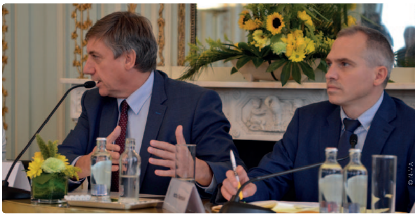
Jan Jambon tijdens de persconferentie over de begroting, samen met Vlaams minister van Begroting en Financiën Matthias Diependaele: “Onze ploeg zal Vlaanderen financieel gezond houden.”

Maar blijkbaar moet ik aan de oppositie en de pers toch blijven uitleggen dat je niet zomaar ergens méér geld kan insteken zonder dat geld elders te gaan halen. Door ergens op te besparen. Of door meer te belasten. En geloof me, dat laatste staat niet in onze planning. Dus zijn er inderdaad hier en daar bepaalde groeipaden die we minder snel laten toenemen. En besparen we verder op onze eigen werking. Ik heb er alle vertrouwen in dat onze ploeg, met Matthias Diependaele als minister van Begroting, Vlaanderen financieel gezond zal houden.”