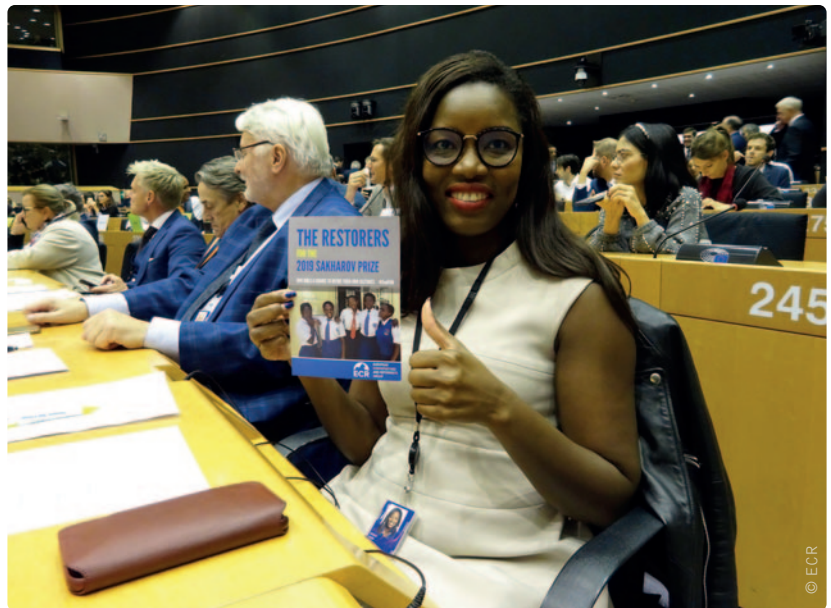
Europarlementslid Assita Kanko verzamelde steun voor het project van The Restorers.

Ook in België bestaat de barbaarse traditie nog. 8 000 meisjes lopen in dit land het risico slachtoffer te worden. Wereldwijd loopt dat aantal zelfs op tot drie miljoen, zo blijkt uit cijfers van de Wereldgezondheidsorganisatie. Bovendien moeten liefst 200 miljoen meisjes en vrouwen vandaag met de vaak verschrikkelijke gevolgen van hun genitale verminking leven.