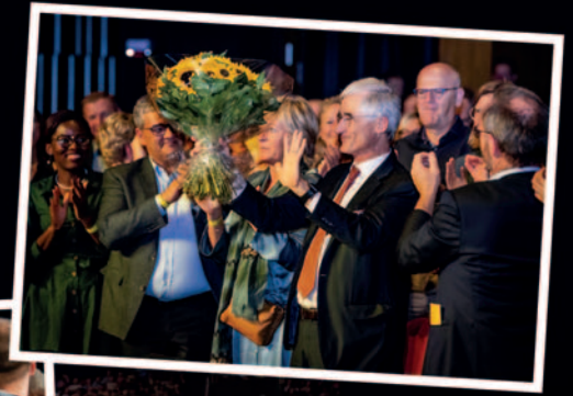
Staande ovatie voor Geert Bourgeois , de man die 18 jaar geleden met de moed van zijn overtuiging de N-VA oprichtte.

Het N-VA-ledencongres sprak zich begin oktober uit over het Vlaams regeerakkoord. De talrijk opgekomen N-VA-leden gaven met veel enthousiasme hun zegen aan het ambitieuze akkoord en aan de regering-Jambon I.