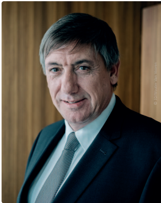
Jan Jambon: “Wat betreft het klimaat hebben we duidelijke doelstellingen: realisme boven idealisme.”

goed is. Ons Vlaams onderwijs behoort tot het beste in de wereld en dat willen we zo houden. Het klopt dat we bepaalde zaken terugdraaien die met de beste intenties waren ingevoerd, maar die uiteindelijk hun doel misten. De afgelopen jaren werd ons onderwijs grondig hervormd. Ons onderwijs verdient nu stabiliteit. Deze regering wil een antwoord bieden op vijf grote uitdagingen: de onderwijskwaliteit, het tekort aan leraren en hun status, de juiste begeleiding van onze kinderen op de juiste plaats, het capaciteitstekort en de studieduur in ons hoger onderwijs.”