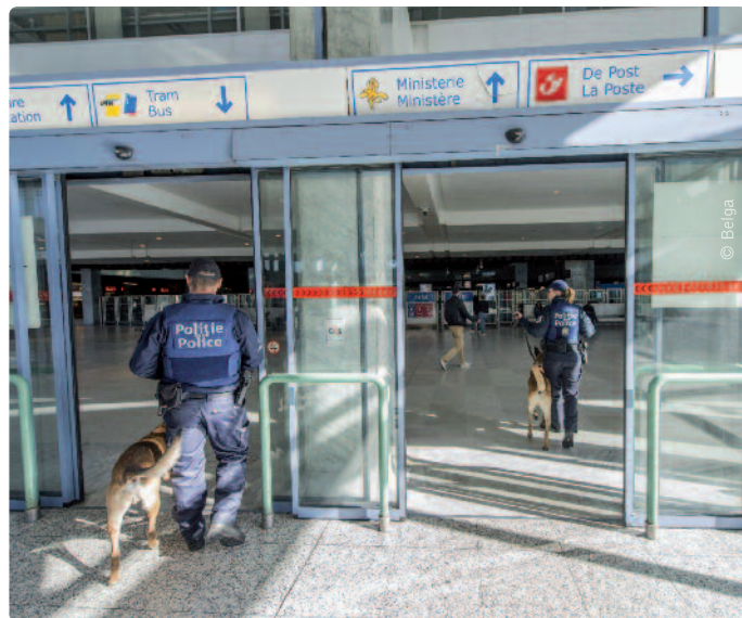
“Sinds we controles doen in Brussel-Noord, daalt het aantal migranten daar drastisch”, zegt Jan Jambon.

“We willen het Brusselse Noordstation teruggeven aan de reiziger.” Minister van Binnenlandse Zaken en Veiligheid Jan Jambon kondigde gecoördineerde politieacties aan tegen de toevloed van migranten in het station van Brussel-Noord. De politie pakt er mensen op die illegaal in het land verblijven en geen asiel aanvragen.