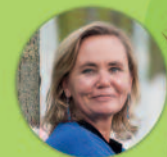
Liesbeth Homans Vlaams minister van Wonen