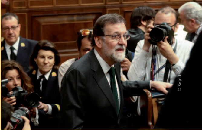
In de val van Mariano Rajoy kwamen alle lijnen samen van veertig jaar Spaanse 'democratie'.

Op 1 juni 2018 viel de Spaanse regering van premier Mariano Rajoy (Partido Popular, PP). Rajoy is de eerste Spaanse premier die moest opstappen omwille van een motie van wantrouwen. Hoewel een veroordeling van de PP voor corruptie de rechtstreekse aanleiding vormde, komen in de val van Rajoy alle lijnen samen van veertig jaar Spaanse 'democratie'. De Catalanen en de Basken spelen daarin een hoofdrol.