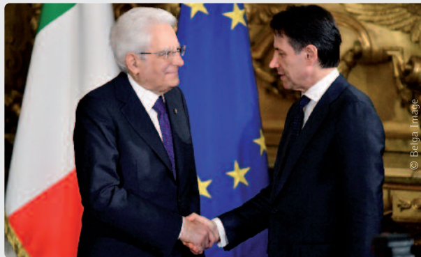
President Sergio Mattarella schudt de hand van de nieuwe Italiaanse premier Giuseppe Conte. Hem wacht de lastige taak om de regering bij elkaar te houden.

De twee coalitiepartners staan dan weer mijlenver van elkaar af op economisch vlak. Giuseppe Conte heeft als