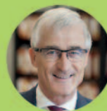
Geert Bourgeois Minister-president van de Vlaamse Regering