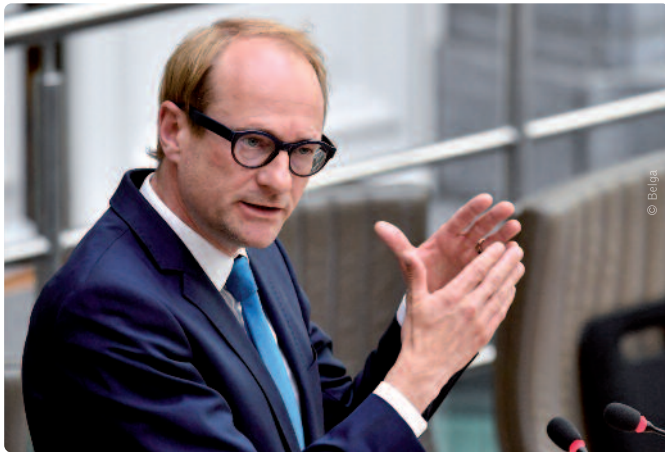
Ben Weyts wil automobilisten verleiden om over te stappen op het openbaar vervoer of de fiets.

Treinstations zijn ideale locaties voor de combiparkings, en die zijn meestal eigendom van de NMBS. “We kunnen blijven roepen dat de NMBS meer moet doen voor de pendelaars. Maar als Vlaanderen zelf investeert, trekken we de zaken vooruit en bepalen we zélf waar en wanneer er nieuwe parkeerplaatsen bijkomen”, besluit de minister. De operatie kost ruim 30 miljoen euro en zorgt in totaal voor 8 000 fiets- en 6 500 autoparkeerplaatsen op combiparkings.