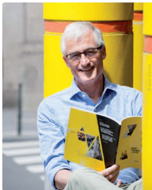
"Met deze Vlaamse Regering is een begroting in evenwicht geen taboe", aldus minister-president Bourgeois.

Ben Weyts was al de minister die de investeringsbudgetten voor De Lijn naar een historische hoogte jaagde, maar bij deze begrotingscontrole verkreeg hij nog eens 23 miljoen euro extra middelen. Het leeuwendeel (20 miljoen) gaat naar de versnelde vergroening van het wagenpark van De Lijn. "Concreet kan De Lijn met dit geld nog eens 50 extra hybride of elektrische bussen bestellen. Zo kan de ambitie om alleen nog maar bussen met een alternatieve aandrijving aan te kopen worden vervroegd", aldus Weyts. Er is ook geld voor meer camera's in de Antwerpse premetrostations (1,5 miljoen euro) en voor minder-hindermaatregelen (1,5 miljoen euro).