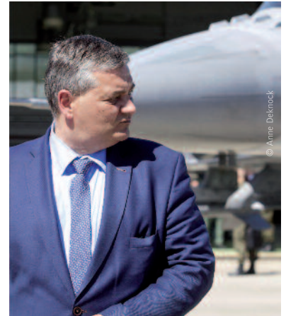
Minister van Defensie Steven Vandeput: "De evaluatie van de offertes is momenteel bezig."

Volgens sp.a wilde Defensie die informatie angstvallig verborgen houden. De socialisten noemen namen van militairen. De nieuwe gevechtsvliegtuigen zouden 15 miljard euro kosten,