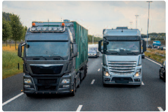
Vaste en mobiele camera's zullen het inhaalverbod voor vrachtwagens streng controleren.

Minister Weyts zet bovendien in op een betere handhaving van het inhaalverbod. “Vroeger was er een verwarrende regelgeving die nauwelijks werd gecontroleerd en dus nauwelijks werd nageleefd. Met de nieuwe regels gaan we ook zorgen voor meer controle”, zegt Weyts.