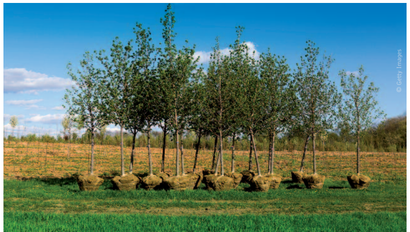
De ultieme manier om CO 2 uit de lucht te halen, is nieuwe bomen planten.

“Ik ben heel benieuwd hoe dat er allemaal concreet zal uitzien. Grote vervuilers zoals ArcelorMittal zitten al in het Europese systeem van emissierechten. Welke concrete maatregelen kan je als land dan nog extra opleggen? De taxshift was al groen, want de belangrijkste financieringsbronnen