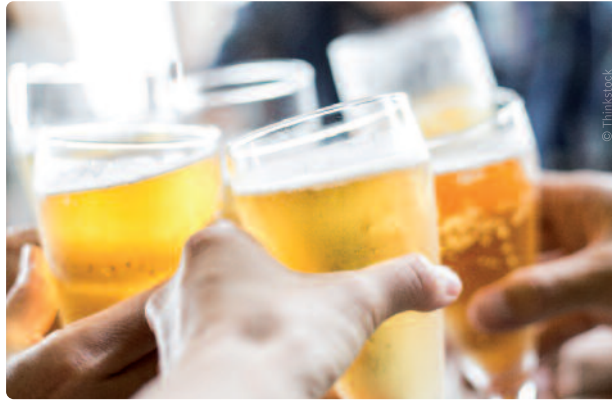
We moeten het taboe doorbreken rond overmatig alcoholgebruik en verslavingen.

Je besluit dan maar om niet deel te nemen, en daarover hoeft je je helemaal niet schuldig te voelen. Een beetje alcohol hoort namelijk bij het leven en bewuster omgaan met je gebruik kan gerust ook terwijl je drinkt. Allemaal dankzij twee woorden: gezond verstand. Beter bekend als de grens tussen naar huis wandelen en naar huis waggelen.