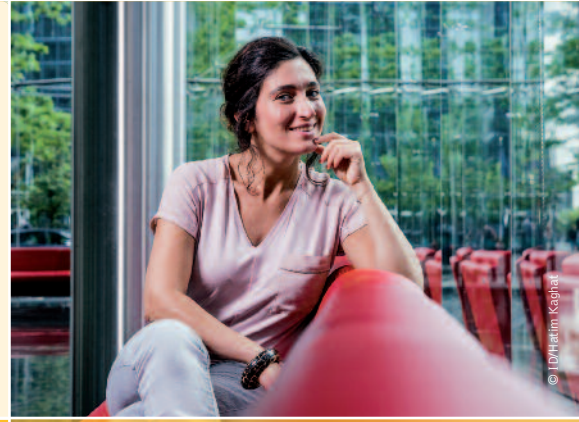
Kamerlid Zuhul Demir

Op 13 februari legden de vakbonden het land weer lam om druk te zetten op de onderhandelingen over de loonnorm in de Groep van Tien. “Er wordt voor miljoenen economische schade aangericht als openingsbod voor een onderhandeling. Dat is onverantwoord gedrag waarmee de vakbonden zichzelf overbodig maken”, zegt Kamerlid Zuhul Demir.