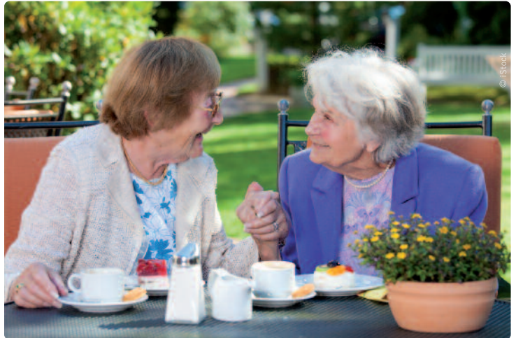
De N-VA maakt komaf met de fiscale pensioenval.

Eind vorig jaar kwam voormalig minister Johan Van Overtveldt als eerste met een volledige oplossing. Door de val van de regering-Michel kon zijn wetsontwerp evenwel niet worden gestemd. Daarom bracht de N-VA de oplossing nu via een wetsvoorstel van Jan Spooren naar het parlement.