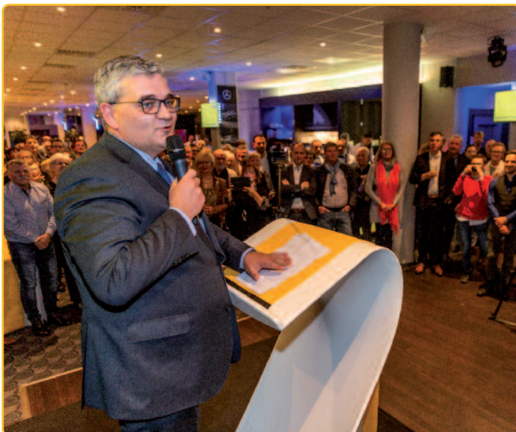
Met meer dan 700 aanwezigen in de Luminus Arena in Genk kende de nieuwjaarsreceptie van N-VA Limburg een absolute recordopkomst!