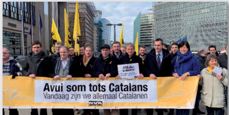
Een ruime N-VA-delegatie betuigde op 12 februari aan het Brusselse Schumanplein haar steun aan de Catalaanse politici die terechtstaan.

Spanje. Ook de gretigheid waarmee bepaalde groepen in de Spaanse samenleving uitkijken naar een zware veroordeling is tekenend. VOX, extreemrechtse partij én stevig in opmars, eist een celstraf van 74 jaar voor bijna alle beklaagden en roept op om meteen een einde te maken