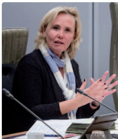
Liesbeth Homans: “Alternatieve stemmen moeten extremisten weerwerk bieden.”

Die tegenverhalen bestaan bijvoorbeeld uit slogans, cartoons of sprekende citaten op Facebook. Videoboodschappen kunnen dan weer de ‘feiten’ van extremistische ideologieën checken en met spraakmakende beelden een historische, neutrale boodschap verspreiden. “Op die manier bieden we weerwerk aan radicale verhalen uit verschillende hoeken van de maatschappij”, besluit minister Homans.