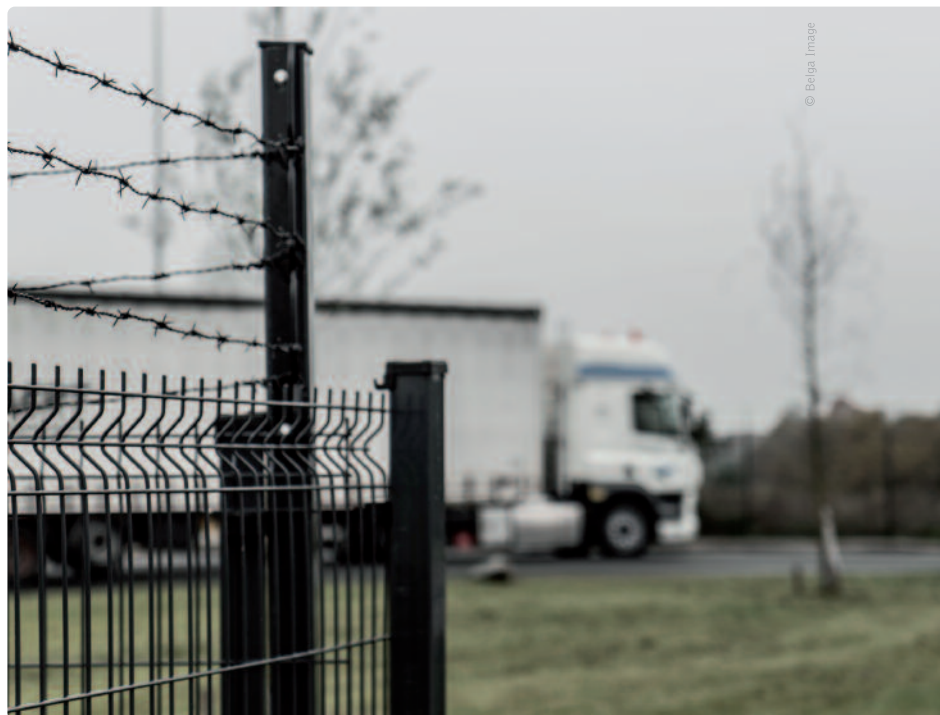
Bovenop de structurele beveiligingsmaatregelen komt er op snelwegparkings ook extra bewaking door privéagenten.

heeft daarom een speciale taskforce bijeengeroepen, die bestaat uit verschillende politie- en gerechtelijke diensten. “De taskforce moet alle informatie die we verzamelen over smokkelbendes transparant bij elkaar leggen, zodat we de bendes met gerichte acties het leven zuur kunnen maken. Dat moet consequent gebeuren. Anders blijft het dweilen met de kraan open”, aldus nog Jambon.