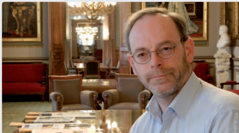
“De internationale steunbetuigingen aan de Koerden bleven erg lauw”, stelt Kamerfractievoorzitter Peter De Roover vast.

De Turkse president Erdogan beroept zich voor zijn aanval op het recht op verdediging van het eigen grondgebied en maakt zo van het internationaal recht een lachertje. De Koerdische overheid in Noord-Syrië viel het Turkse grondgebied nooit aan.