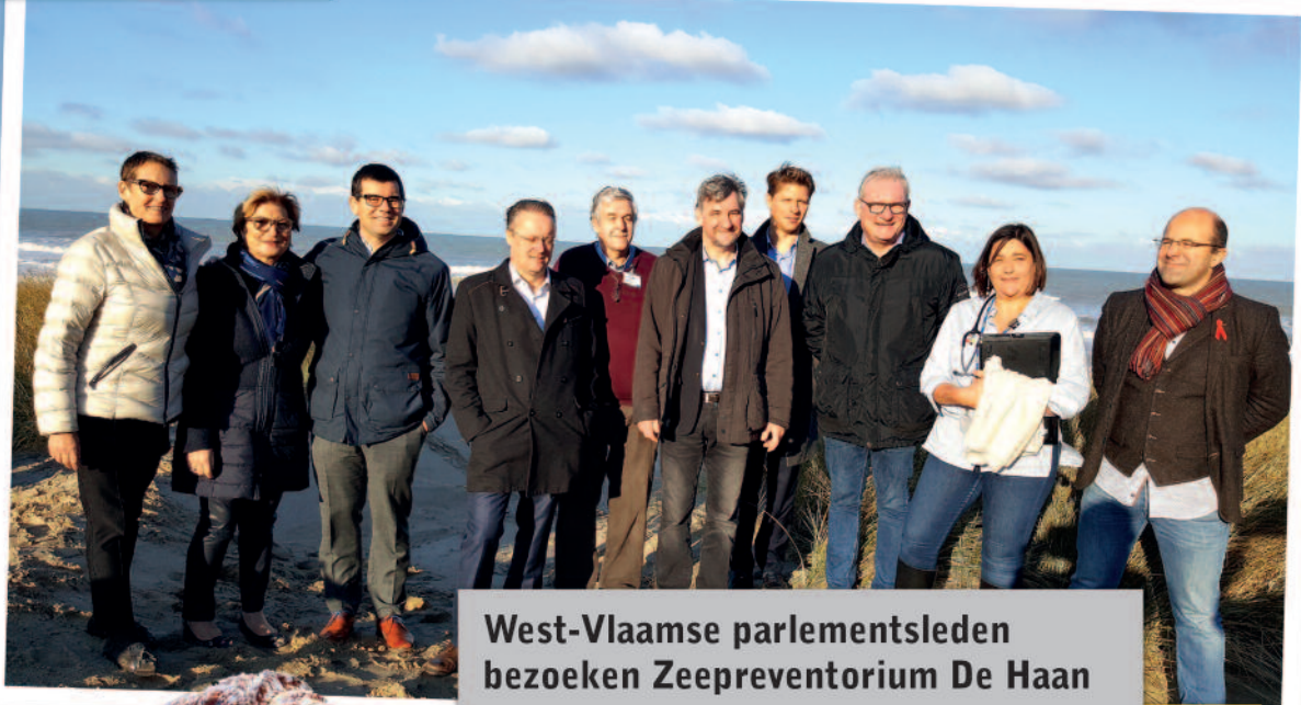
West-Vlaamse parlementsleden bezoeken Zeepreventorium De Haan

Een tiental West-Vlaamse parlementsleden bracht onlangs een werkbezoek aan het gerenommeerde Zeepreventorium in De Haan. Het Zeepreventorium werd in 1925 opgericht met de steun van de familie Solvay, om tuberculosepatiënten te verzorgen. Later verschoof de klemtoon naar jonge patiënten met astma en mucoviscidose. Vandaag worden er ook obesitas en enkele zeldzame aandoeningen behandeld.