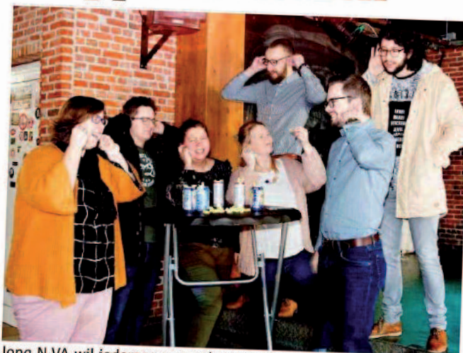
Jong N-VA wil iedereen waarschuwen voor gehoorschade.

De actie kreeg meteen steun van de twee Desselse jeugdhuizen JC Spin en JG Scharnier.