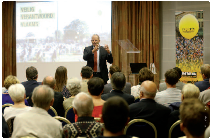
In de nieuwjaarstoespraken die Theo Francken overal te lande geeft, hamert hij op één ding: het thuisgevoel van de Vlaming versterken.

“Als ik lees dat het aantal zelfmoorden enkel in Finland hoger ligt, als ik hoor dat er duizenden kinderen in Vlaanderen aan de antidepressiva zitten, dan denk ik: er scheelt iets met onze maatschappij. We missen geborgenheid. We missen zekerheid. We mankeren zelfvertrouwen. Dat heeft verschillende oorzaken, gaande van een doorgeslagen individualisering en een gevoel van culturele vervreemding tot een