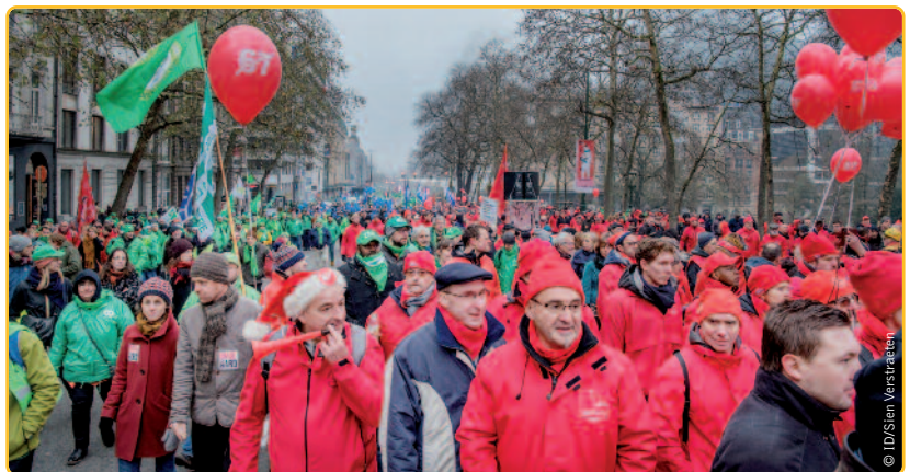
Als het van de vakbonden afhangt, verzuipen de jongeren van vandaag in de pensioenlasten van de ouderen van morgen.

heen. Daarenboven worden mensen gestimuleerd om langer dan 45 jaar te werken. Extra gewerkte jaren bouwen immers extra pensioenrechten op. Een zeer welgekomen verandering die opnieuw tot meer mensen aan de slag en minder mensen op pensioen zal leiden.