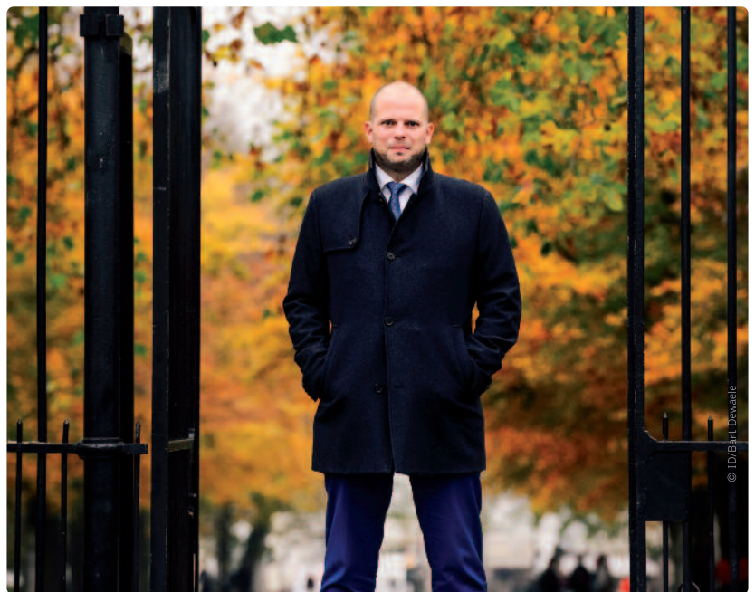
Theo Francken: “Wie in ons land wil blijven, moet bereid zijn open kaart te spelen en dat kan maar door een asielaanvraag in te dienen. Zo simpel is het.”

“Het kriebelt zeer zeker. Dat voorstel van de koepel van het vrij onderwijs voor islamitische gebedsruimtes en hoofddoeken op school, is een aanslag op de ziel van de katholieke scholen. Hoe wereldvreemd kan je zijn? Dat men zo schrok van de heftige reacties zegt eigenlijk alles. Maar wat me nog het meest verontrust in het onderwijsdossier, is dat nu ook het segment van de sterkste leerlingen voor het eerst ach-