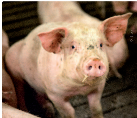
Dierenbeulen kunnen voor 18 maanden achter de tralies vliegen.

Bovendien stijgt de pakkans. Een inspectieteam zal bijvoorbeeld specifiek toezicht houden op de werking van de slachthuizen. Ook verantwoordelijken voor dierenwelzijn in lokale politiezones en bij de parketten zijn in 2018 een bondgenoot in de strijd tegen dierenleed.