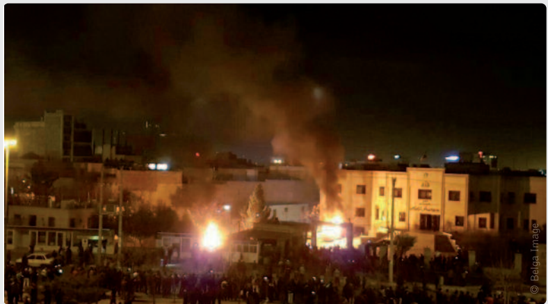
Voor het eerst in bijna tien jaar protesteren Iraniërs openlijk tegen het islamitische regime.

Maar de prille handelsrelaties en de goede uitvoering van het