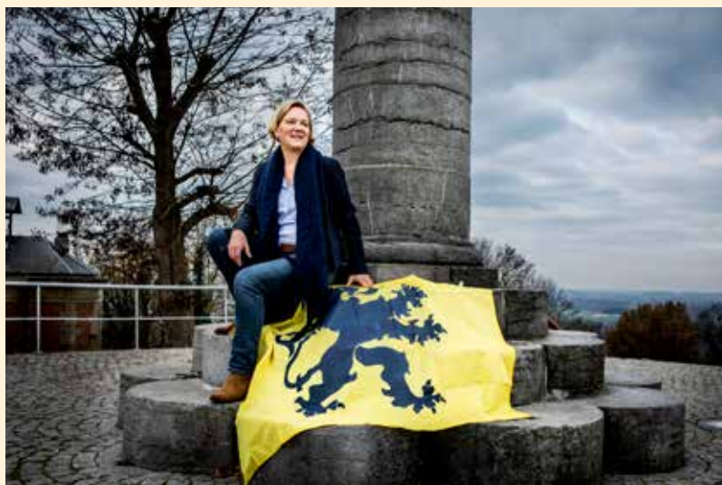
‘Ik wil een luisterend oor zijn voor alle afdelingen en voor elk lid.’